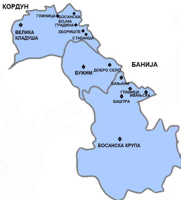
Српска села на Сувој Међи

На простору Суве Међе у северозападном делу Босанске Крајине налазе се села: Ивањска, Главица, Баштра, Бањани (општина Босанска Крупа), Добро Село, Чава (општина Бужим), Стабанца, Збориште, Градина, Босанска Бојна, Буковље и Глиница са својим засеоцима (општина Велика Кладуша). 2 Ова села гравитирају ка средишњем току реке Уне, њеној левој обали, а у административном смислу данас општине у којима се налазе су у саставу Федерације Босне и Херцеговине. Територија села Ивањска се на југу наслања на леву обалу реке Уне, на североистоку је Сува Међа, а на западу су села Баштра и Главица. Идући ка северу, налази се село Бањани, северозападно се налази планина Ђорковача, а даље на западу је Добро Село. Северно од Доброг Села се наставља Сува Међа, док је на западу село Чава са истоименим потоком. Североисточно од потока Чаве је село Стабанца, док је северозападно село Збориште, а идући даље уз Суву Међу на крајњем северозападу Босанске Крајине налазе се села Босанска Бојна и Глиница. Ова два села су на горњем току реке Глине којом се завршава Сува Међа.